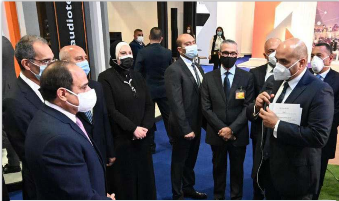
زيارة الرئيس عبد الفتاح السيسي لجناح اتصالات مصر بمعرض Cairo ICT

يذكر أن معرض كايرو اى سى تي، هو الحدث السنوي الإقليمي لقطاع التكنولوجيا بمصر وأفريقيا، ويعد الحدث الأهم في مصر، حيث أصبح مظلة تجتمع تحتها وزارات مصر الحكومية التي تعمل على تقديم خدماتها الإلكترونية للتيسير على المواطنين وتحقيق التحول الرقمي، كما يشهد الحدث أكبر تجمع للشركات التكنولوجية المصرية والعالمية، سواء بقطاعات النقل الذكي والمدن الذكية والشمول المائي والحلول التكنولوجية.