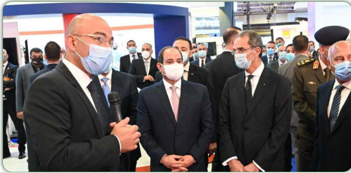
الرئيس السيسي ورئيس الوزراء ووزير الاتصالات يستمعون الي شرح الرئيس التنفيذي لاورنج خلال تفقد جناح الشركة بمعرض Cairo ICT 2020