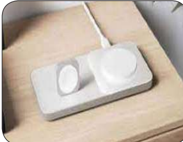
كتب : محمد الخولي - وائل الحسینی

وعلى الجانب الأيسر يوجد قرص شحن الساعة الذكية آبل ووتش، حيث يحتفظ بالساعة الذكية في وضع قفاتها، ويمكن شحنها مع استعمال أساور Solo Loop ، Link Bracelet (واحد تاني ) بطولة 150 دولار .