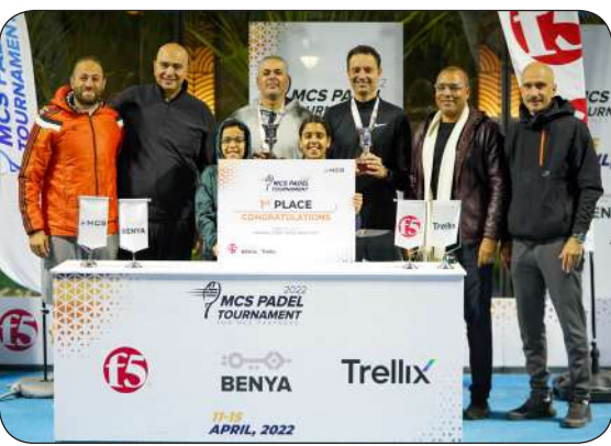
كتب : باكينام خالد - محمد شوقي

تجدر الإشارة إلى أن الدورة الثانية من بطولة MCS لرياضة البادل التي تعتبر واحدة من رياضات المضرب المختلفة عن رياضة التنس الأرضي، حيث إنها تلعب بشكل زوجي في ملعب مغلق أصغر بحوالي 25% من حجم ملعب التنس انعدت تحت رعاية مجموعة بنية، وشركة F5 العالمية وشركة تريليكس.